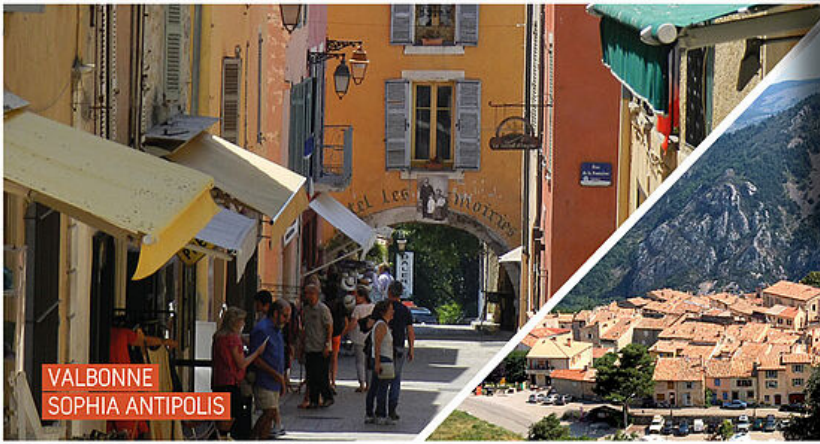
VALBONNE SOPHIA ANTIPOLIS

COMMUNAUTÉ D'AGGLOMÉRATION SOPHIA ANTIPOLIS